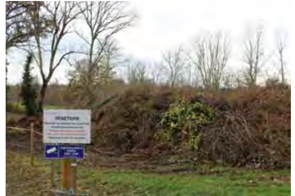
Végétérie de Saint-Sébastien

Des projets de végéteries sont en test ou à l'étude dans plusieurs communes de notre territoire. Si les essais s'avèrent concluants, d'autres initiatives similaires pourraient voir le jour.