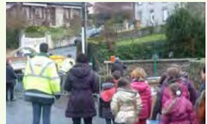
Opération de broyage en 2014, en présence de la presse et de l'école primaire

Pour rappel, Evolis 23 propose également un service de broyage à domicile. En plus d'éliminer efficacement vos tailles, branches... le broyage permet de récupérer des copeaux, que vous pourrez réutiliser dans votre jardin, pour le paillage et le compostage par exemple.