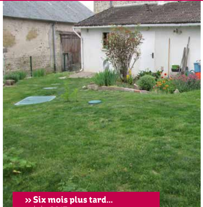
» Six mois plus tard... - juin 2017

Le couple fait ainsi partie des premiers usagers du SPANC à déposer leur dossier de candidature, en novembre 2015. « Une démarche très simple », tient à préciser Claude MONNET.