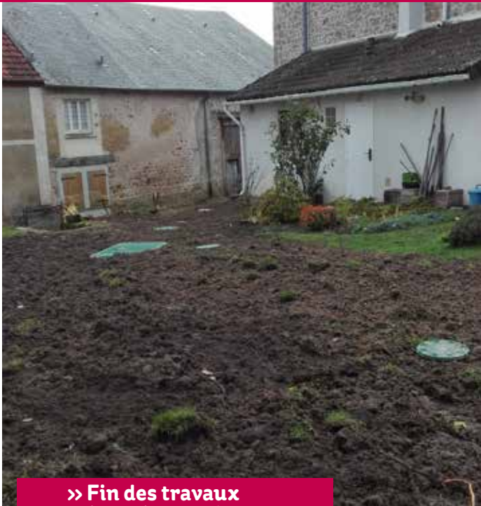
» Fin des travaux - décembre 2016